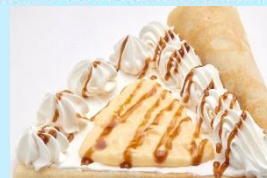
カスタードキャラメルクリーム