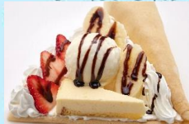
いちごバナナチョコ ケーキスベシャル