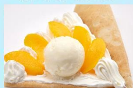
ピーチスベシャル