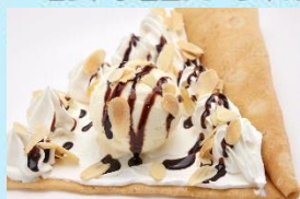
アーモンドチョコスベシャル