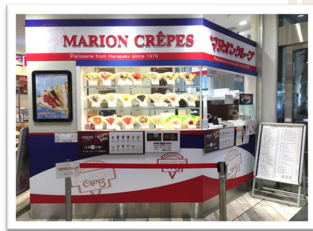
ウィングキッチン京急川崎店