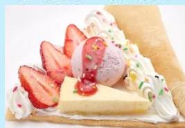
いちごケーキメルバ