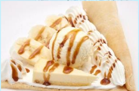
バナナキャラメル ケーキスベシャル