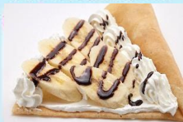
バナナチョコクリーム