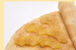
シナモンアップル