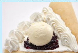
ブルーベリージャムスベシャル