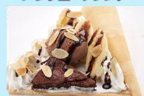
ブラウニークランチ