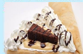
カスタードチョコブラウニー