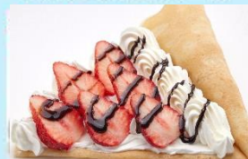
いちごチョコクリーム