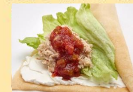
ツナチリペッパーチーズ