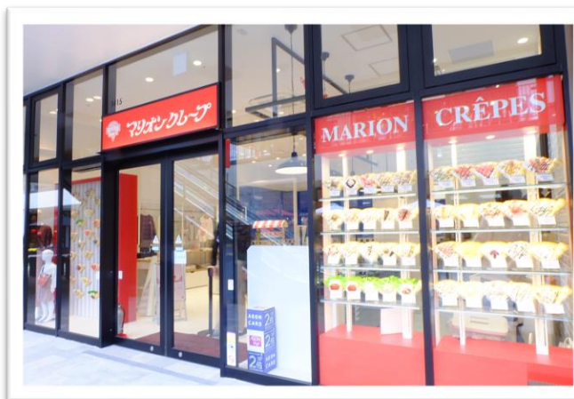
ジ アウトレット 湘南平塚店