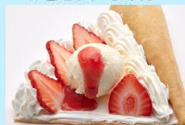
いちごスベシャル