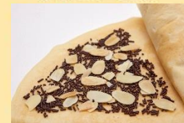
チョコアーモンド