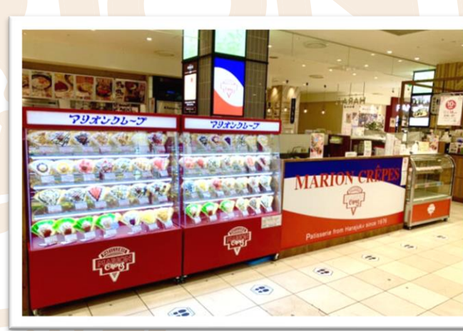
マルイファミリー志木店