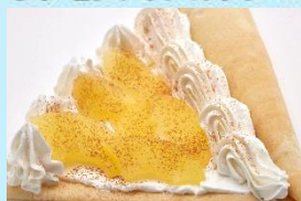
シナモンアップルクリーム