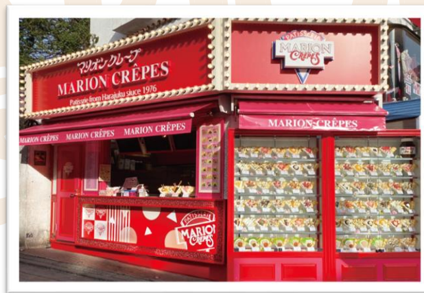
現在の原宿竹下通り店