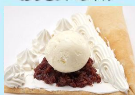
あずきスベシャル